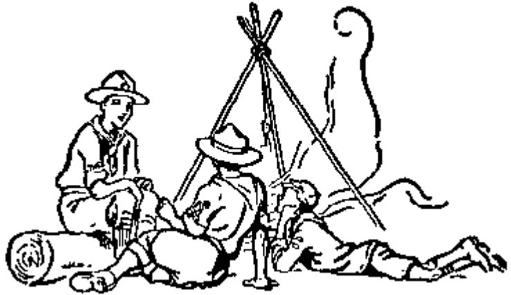
Miembros de la familia Scout: Lobato, Scout y Rover Scout.

El primer paso que se debe dar para el éxito en el adiestramiento de un scout es tratar de conocer algo de la vida de los muchachos en general y luego la de éste en particular.